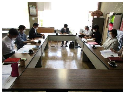
6/2 東部共同学校事務室運営委員会

5月末から6月初めにかけて、各共同学校事務室の運営委員会を行いました。運営委員会には室内の学校の校長と事務職員が出席し、今年度の各室の活動計画を話し合いました。